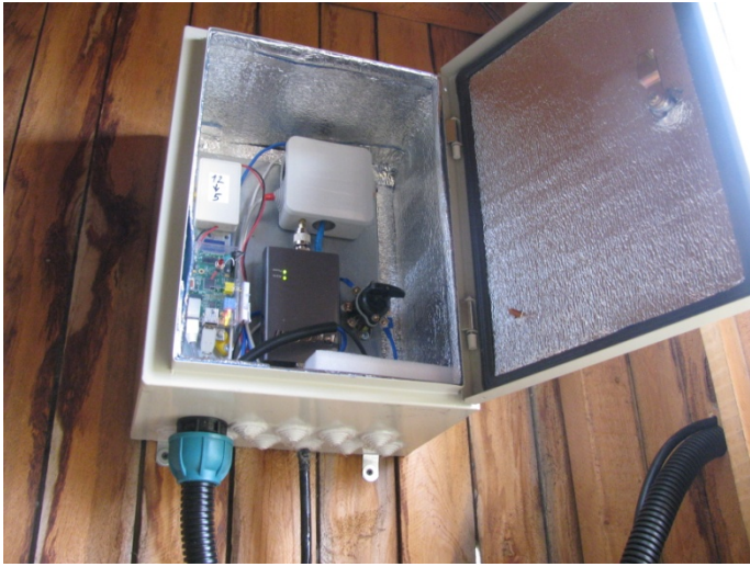
Щиток с оборудованием