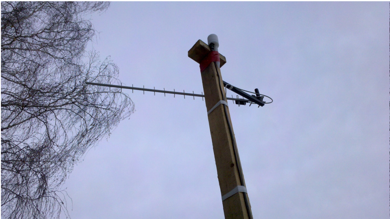
Антенна и GPS